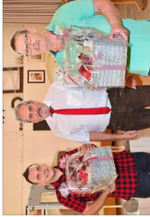
Regier dankte den Mitgliedern des Fotoclubs, die die Bilder der Stadt schenken.

Regier dankte allen Verantwortlichen und Künstlern für die Organisation dieser repräsentativen Aus-