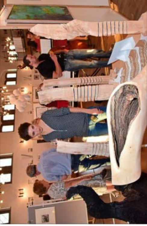
Kunstobjekte sind reichlich da.